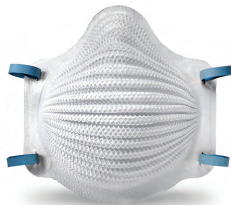
Clássico com 2 tiras 4200 N95 Médio/Grande 4201 N95 Pequena CA: 33.295