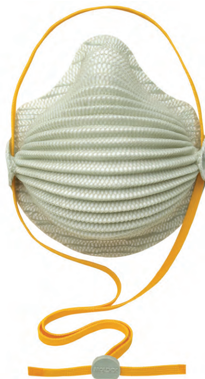
SmartStrap® Exclusivo 4600 N95 Médio/Grande 4601 N95 Pequeno CA: 33.294